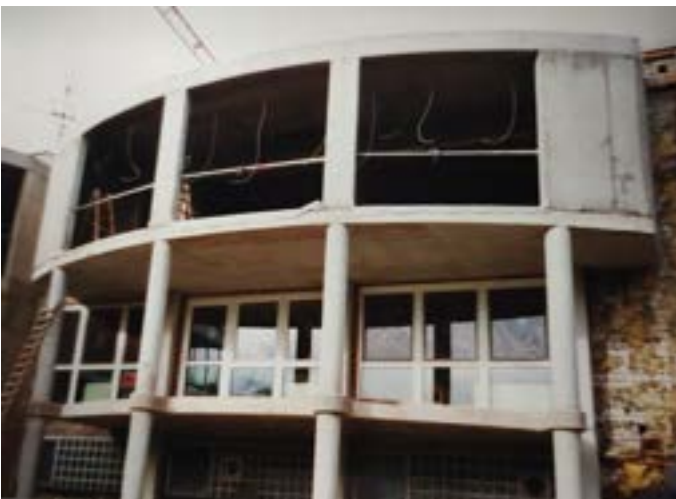
Erweiterung des Großen Saals und Neubau Balkon Tagespflege 2001