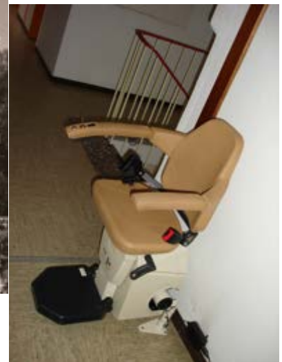
Treppenlift im alten Haus Ruhrblick