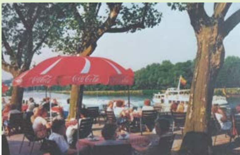
Gaststätte „Der Ruhrgarten“

1998-2002 weiterer Umbau: Neubau der „Muckibude“, Anbau/Erweiterung Großer Saal, Tagespflege, Wintergärten 1999 Eröffnung der Tagespflege 2009 Gründung Förderverein 2012 Abriss Haus Ruhrblick 2013 Wiedereröffnung Haus Ruhrblick