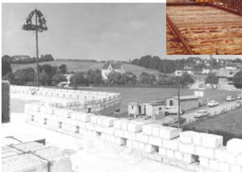
Richtfest an der Mendener Straße