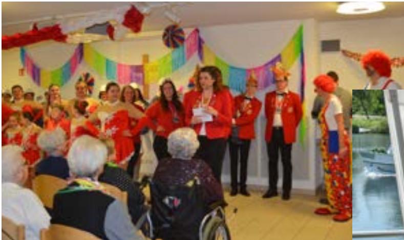
Der jährliche Besuch des Karnevalsvereins

Immer wieder schön: Kaffeetrinken an der Ruhr