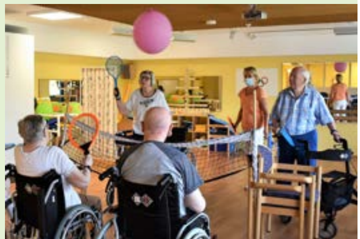
Spaß in der Bewegungsgruppe