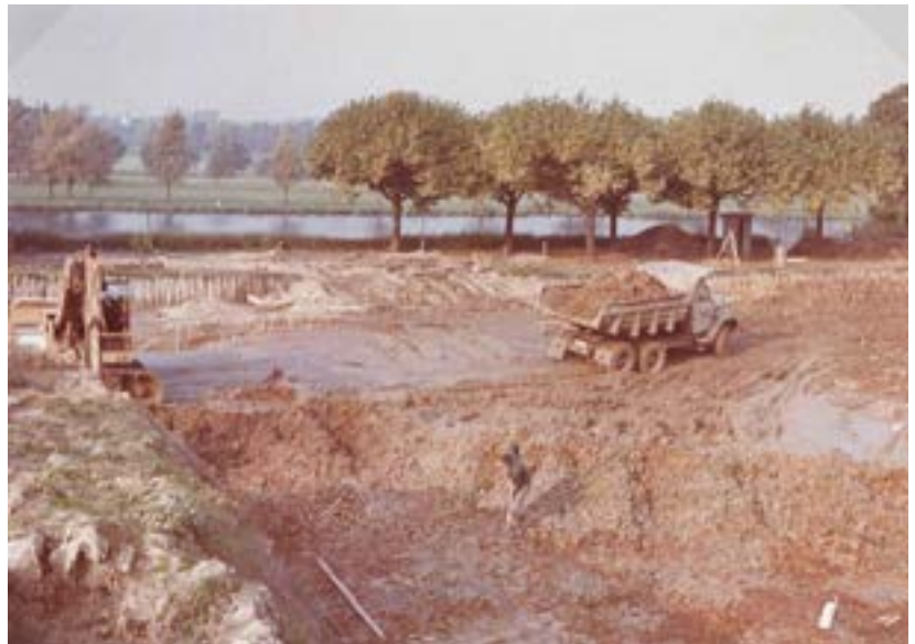
Der Untergrund wird vorbereitet

Da allerdings nicht genug Mitarbeiter ein Apartment benötigten, zogen auch hier Seniorinnen und Senioren ein.