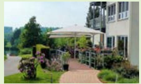
Haus Ruhrblick Mulhofs Kamp 5a 45470 Mülheim an der Ruhr