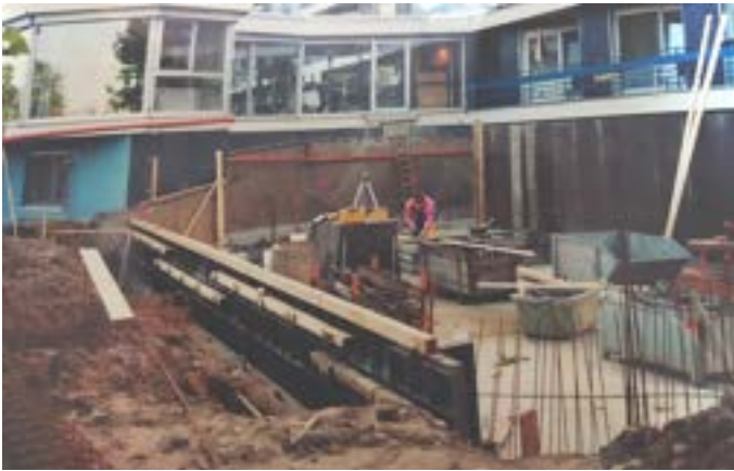
Für ein erweitertes Therapieangebot und verbesserte Räumlichkeiten in den Wohnbereichen: Bau der „Muckibude“ und Erweiterung/Ausbau der Wintergärten