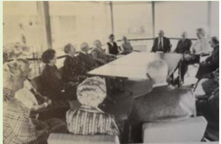
Gesprächskreis in den 70er Jahren

So heißt es in einem Prospekt aus den Anfangsjahren, darin sehen wir bereits Fotos von Bewegungsrunden, Gesprächskreisen, musikalischer Unterhaltung und Gottesdiensten.