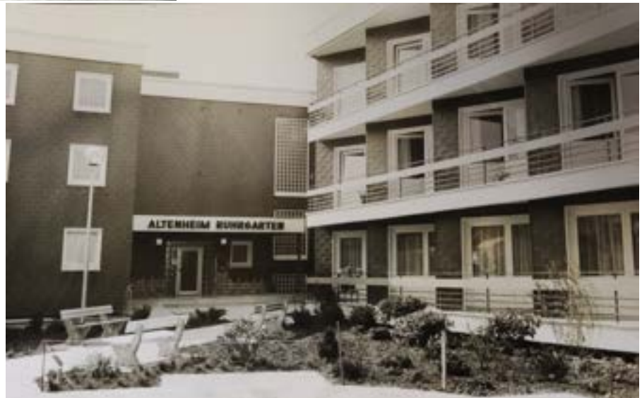
Eingang Haus Ruhrgarten