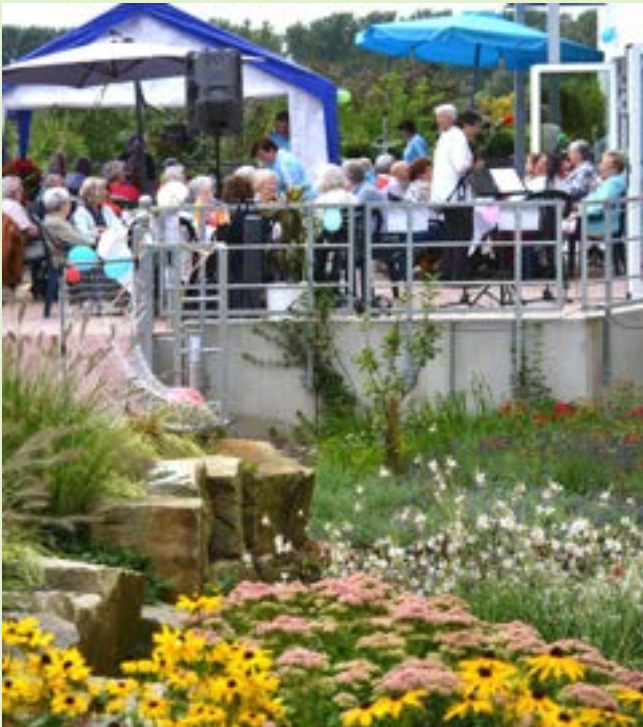
Sommerfest im Haus Ruhrblick

In dieser Tradition sehen wir uns auch im Jahr 2024: Es geht um eine lebendige Gemeinschaft, um die Aktivierung von Ressourcen, die der Einzelne unabhängig vom Alter noch hat - kurz gesagt um Lebensfreude und Lebensqualität.