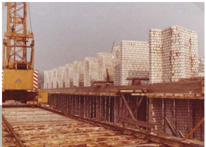
Die einzelnen Apartments sind schon zu erkennen